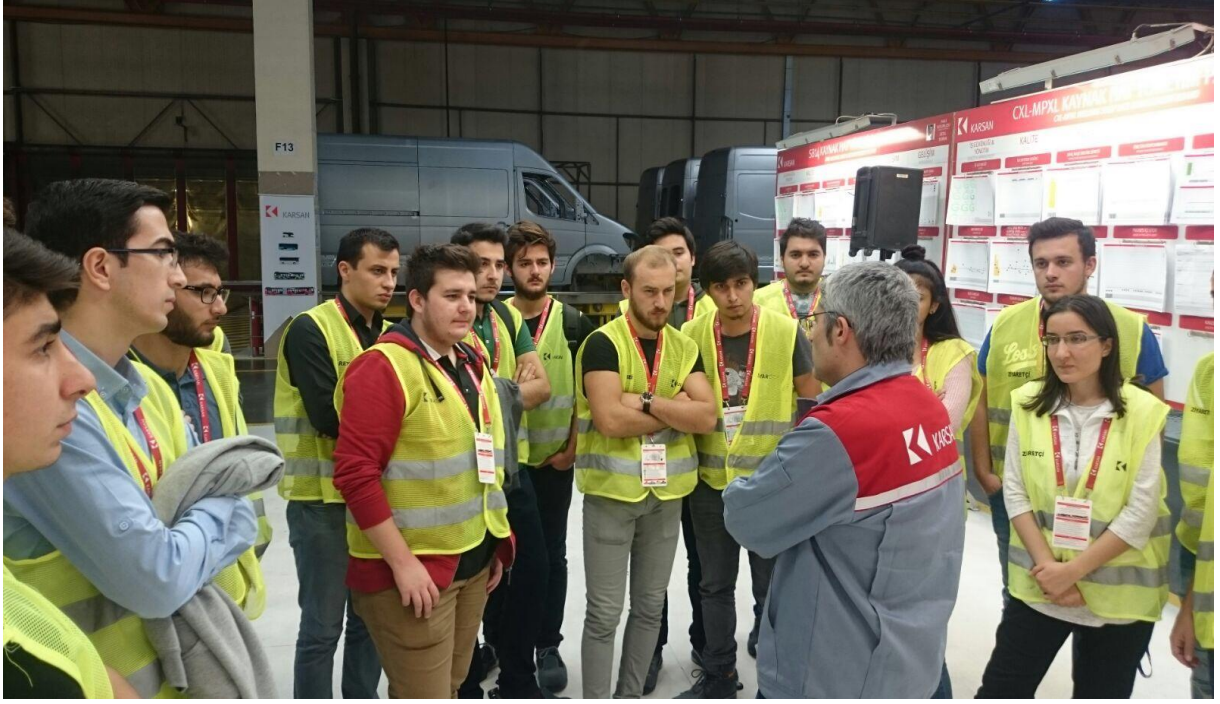
Karsan Bursa Teknik Gezisi