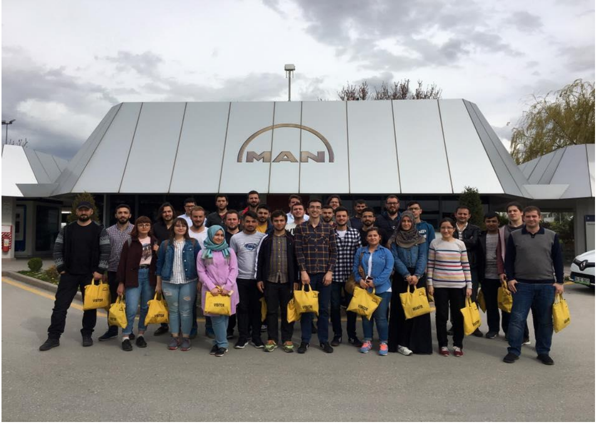
MAN Ankara Kamyon & Otobüs Fabrikası Teknik Gezisi