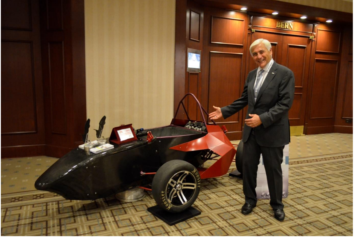
IAEC'de (International Automotive Engineering Conference) o sıralar üretim aşamasında olan Uludağ Racing FSAE Team'e ait "UR04" adlı araç sergilendi.