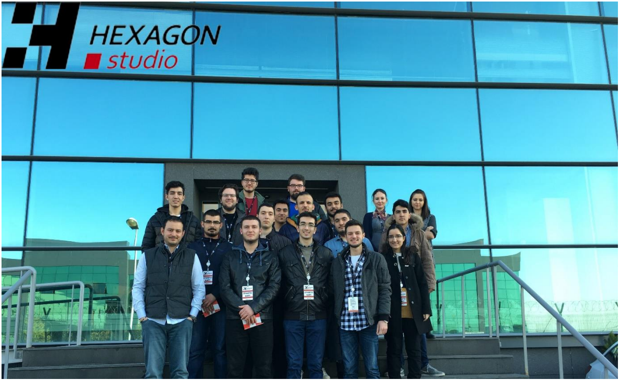
Hexagon Studio Kocaeli Teknik Gezisi