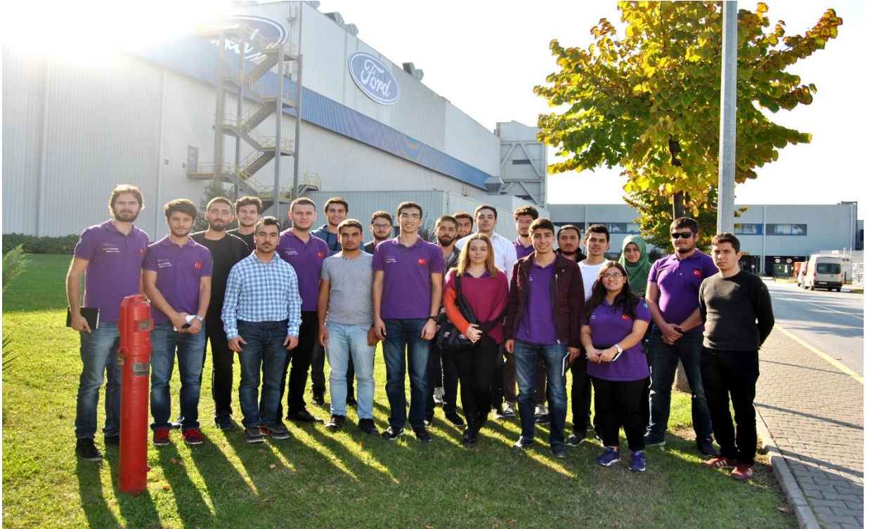
Ford Otosan Gölcük Fabrikası Teknik Gezisi