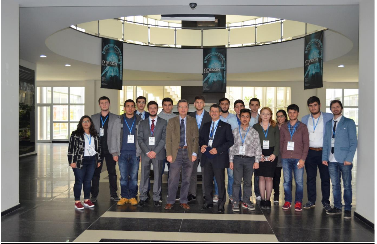
“ TOMOSEB ” (Türkiye Otomotiv Mühendisleri ve Otomotiv Sektörü Buluşması) Konferansı