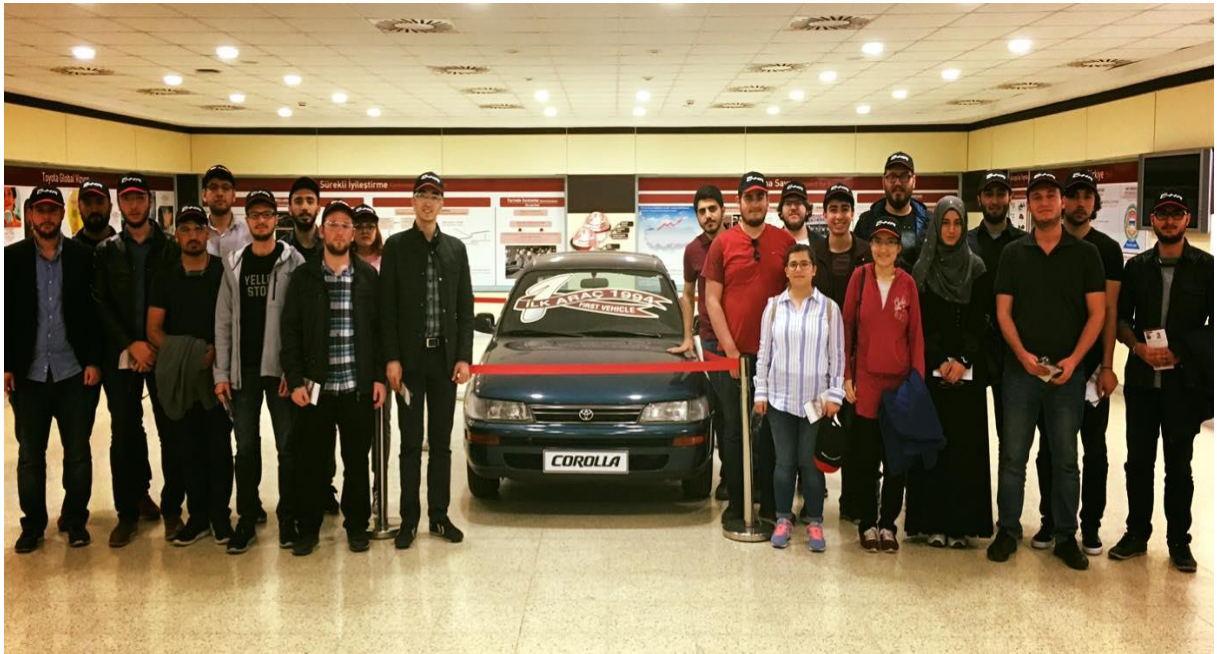
Toyota Sakarya Fabrikası Teknik Gezisi