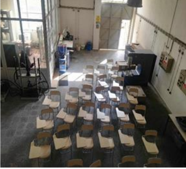
Laboratuvar Genel Görünümü