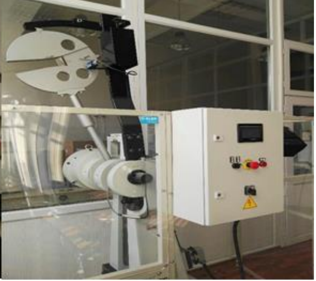
Çentik-Darbe Test Cihazı