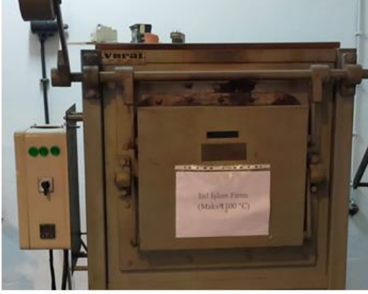
Isıl İşlem Fırını Maks 1100° C