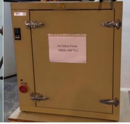
Isıl İşlem Fırını Maks 600° C