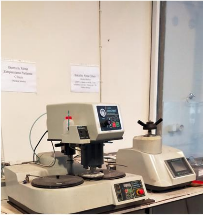
Metal Zımparalama ve Parlatma Cihazı