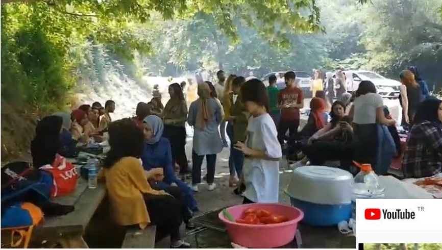
Uludağ Üniversitesi Maliye Bölümü Mezuniyet Pikniği (2019) 🧑🏻🧑🏻