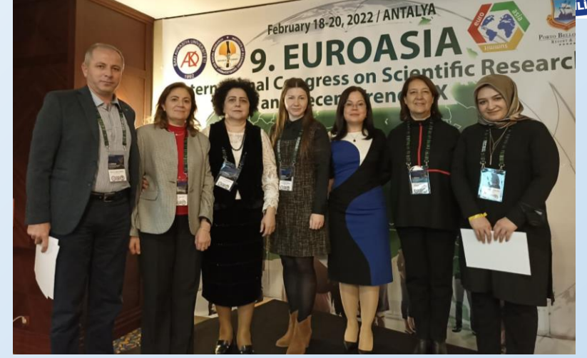
9. Euroasia International Congress on Scientific Research and Recent Trends