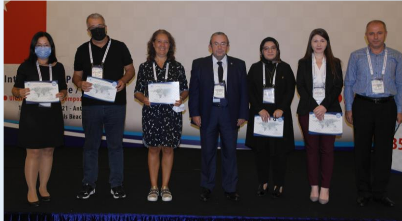
35. Uluslararası Maliye Sempozyumu