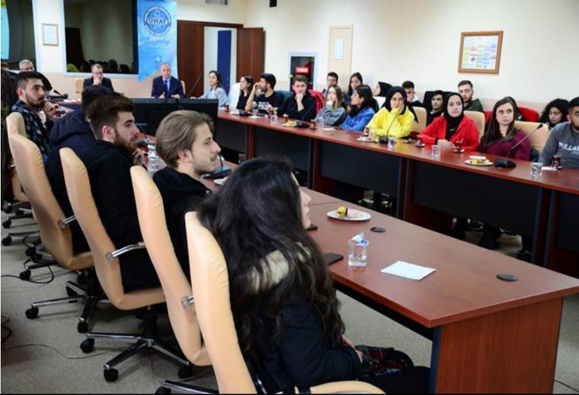
Ankara Gelir İdaresi Başkanlığı – Teknik Gezi