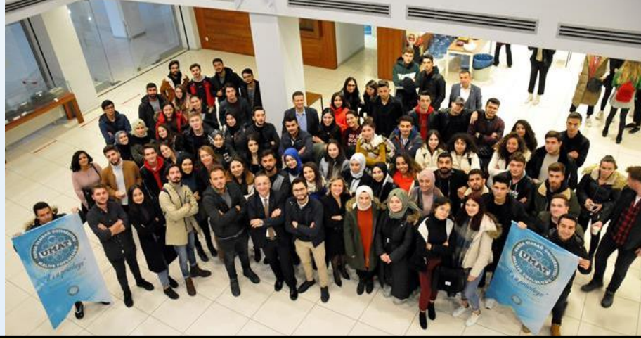
Bursa SMMM Odası Ziyareti – Teknik Gezi