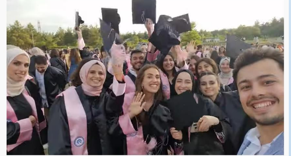
Bursa Uludağ Üniversitesi Maliye Bölümü 2021-2022 Kep Atma Töreni 🧑🏻🧑🏻