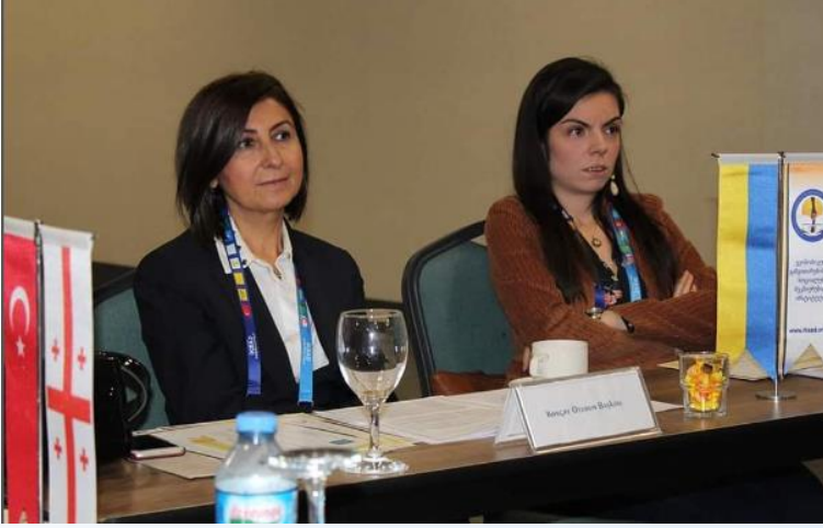
International Congress on Social Sciences, China to Adriatic