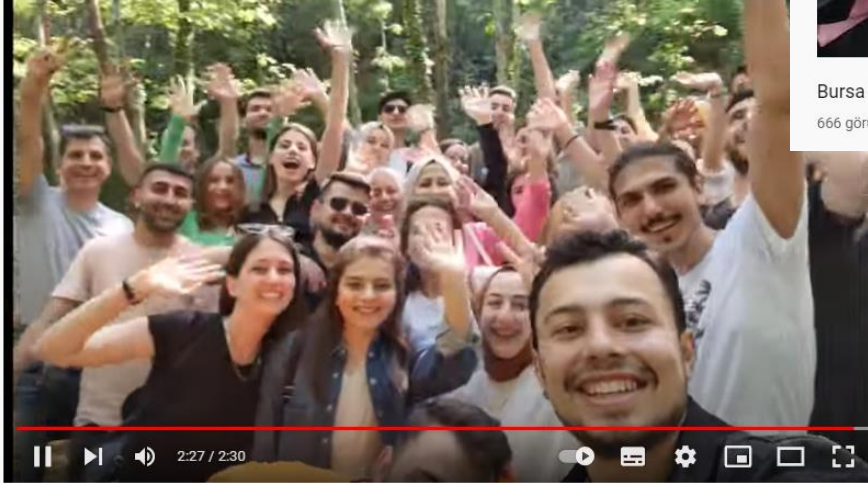
(2022) Bursa Uludağ Üniversitesi Maliye Bölümü Mezuniyet Pikniği Vlog 🧑🏻🧑🏻