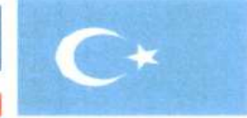
Doğu Türkistan Bayrağı