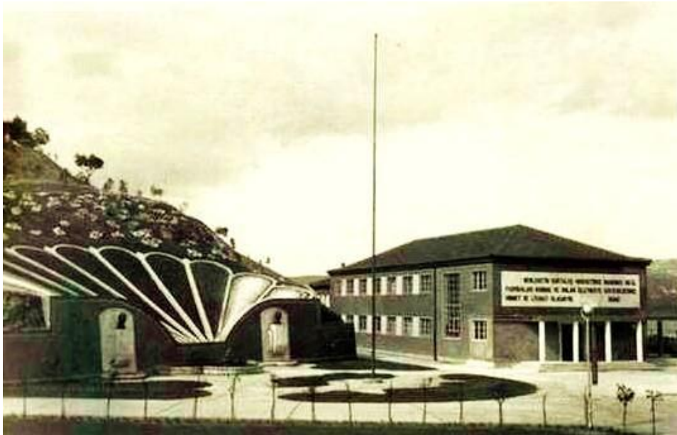
Sunğipek Fabrikası İdare Binası (1950). Fotoğraf

Sunğipek Yerleşkesinde Hukuk Fakültesi binalarının yapılması işini Asım Kocabıyık Kültür Eğitim Vakfı (AKKEV) üstlenmiştir. Bu konuda AKKEV ile Bursa Uludağ Üniversitesi yapılan protokol, 2 Mayıs 2007 tarihinde Sunğipek Yerleşkesinde törenle imzalanmıştır.