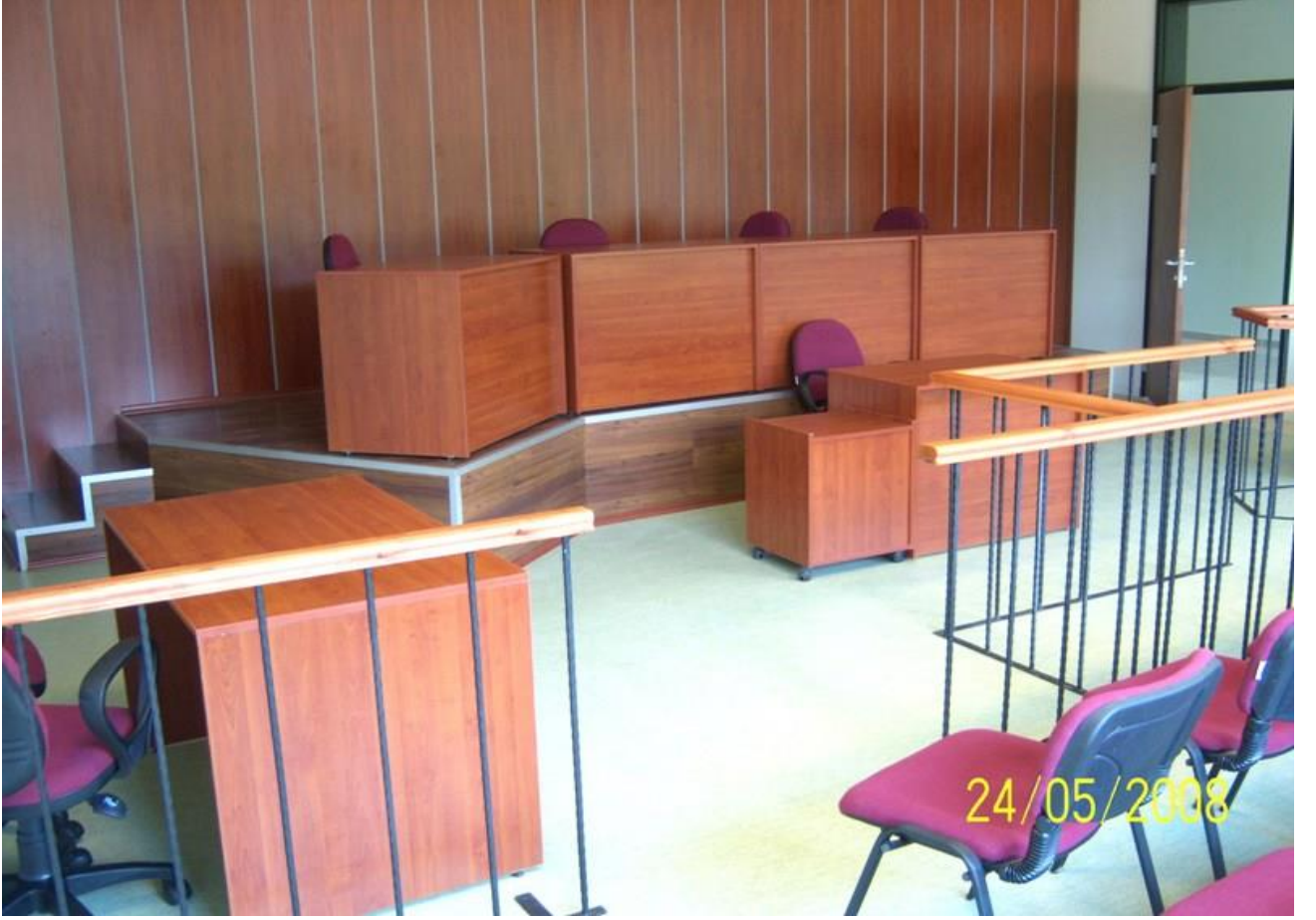
Hukuk Fakültesi Eğitim Binası (“Duruşma”-Uygulama Salonu) - Mayıs 2008

Fakültemizde eğitim amaçlı bir “ Duruşma Salonu ” vardır. Genellikle Usul Hukuku (uygulama) derslerinde kullanılmaktadır.