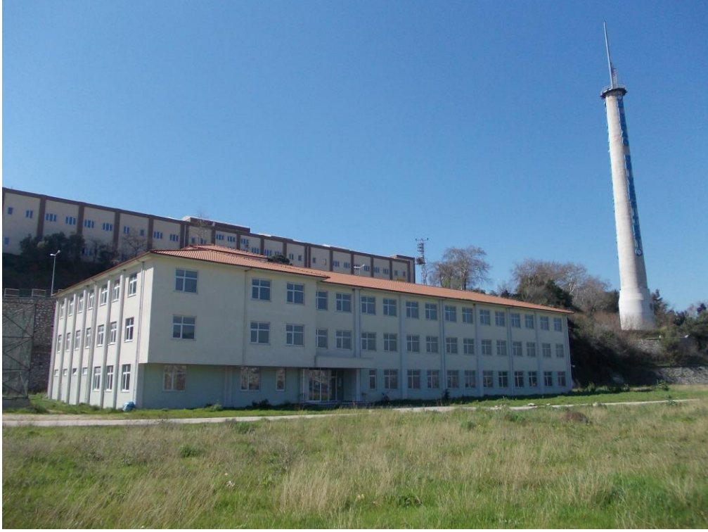
Hukuk Fakültesi Eđitim Binası( DYO) Kasım 2011 (Gemlik Belediyesi'nce hibe edilmiştir)

Eđitim Binası; Fakültemize geçici olarak, iki derslik, üç Asistan odası, üç öğrenci temsilciliđi ve topluluklar odası ile iki öğretim üyesi odası kullanılmaktadır.(500 m2)