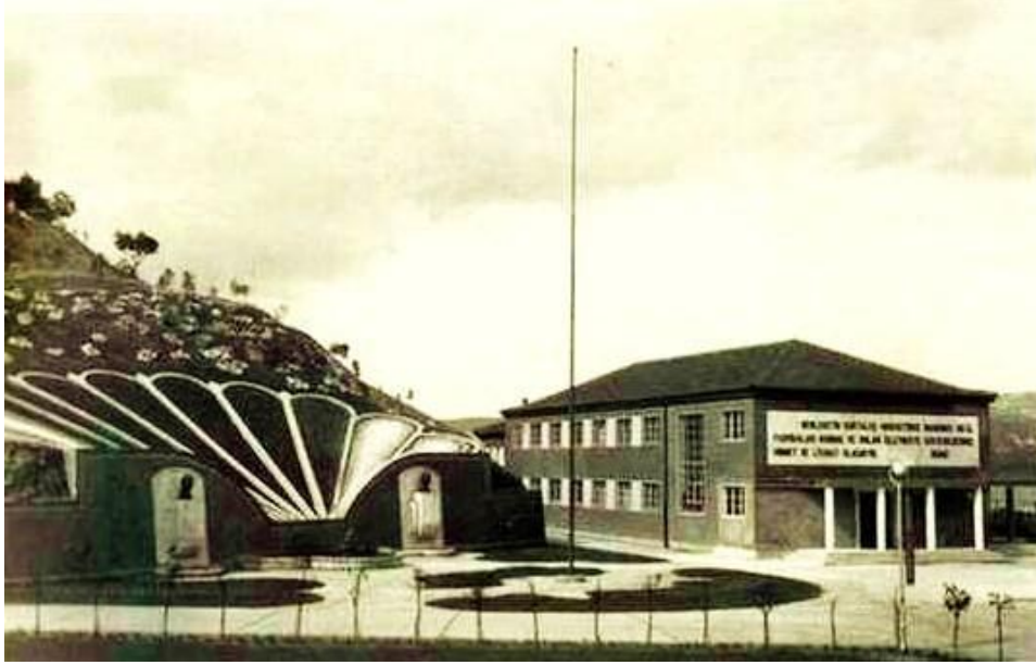
Sunğipek Fabrikası İdare Binası (1950). Fotoğraf

“Genel Bilgiler” başlığı altında biriminizle ilgili yetki, görev ve sorumluluklarına, fiziksel kaynaklarına, örgüt yapısına, bilgi ve teknolojik kaynaklarına, insan kaynaklarına, birim tarafından sunulan hizmetlere (eğitim, sağlık, idari) dair bilgilere, iç ve dış denetim raporlarında yer alan tespit ve değerlendirmelere kısaca yer verilir.