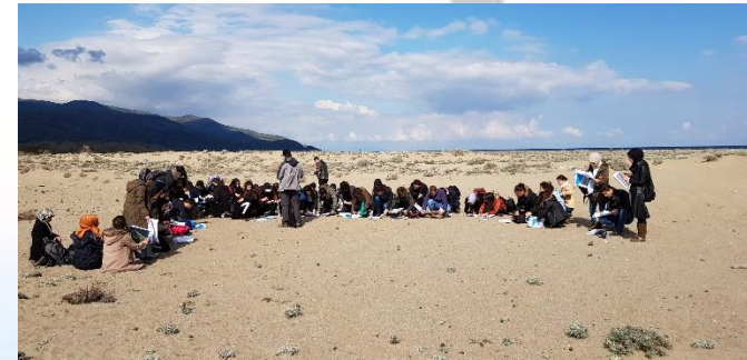
Fotoğraf 3- Arazi Çalışması: Coğrafya'da Arazi Çalışmaları I Dersi Teknik Gezisi