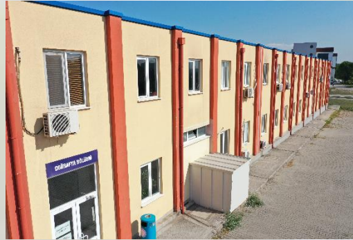
Fotoğraf 1: Bursa Uludağ Üniversitesi Fen-Edebiyat Fakültesi Coğrafya Bölümü

Coğrafya Bölümü, mensubu olduğu coğrafya biliminin köklü tarihi temelleri yanında dinamik ve çağa ayak uyduran yapısı sayesinde “zamanın ruhunu” yakalayan bilim dallarından birisidir. Bugün tarımda rekolte hesaplarından, uydu görüntüleri ile uzaktan algılama ve analizlere, afet yönetimi ve analizlerinden, şehirlerde arazi kullanımına kadar son derece yaygın ve güncel sorunlara çözüm üreten bir bilim haline dönüşmeyi başarmış bir bilimdir.