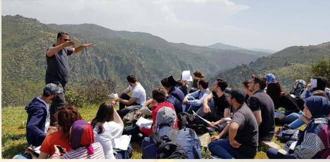
Fotoğraf 4- Arazi Çalışması: Genel Jeomorfoloji II Dersi Teknik Gezisi