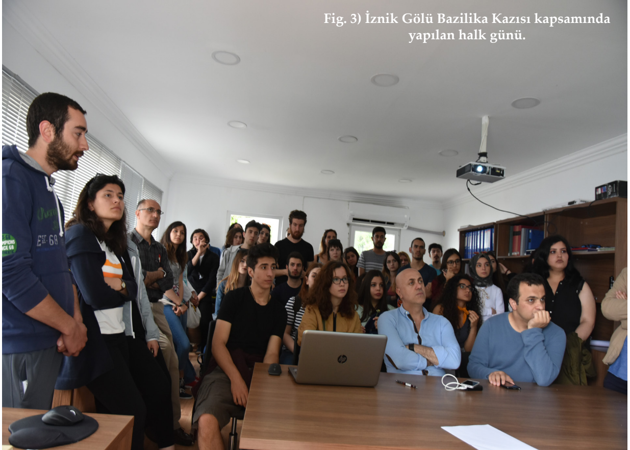
Fig. 3) İznik Gl Bazilika Kazısı kapsamında yapılan halk gn.

Sonu olarak sualtında olsun, karada olsun her trl kazı veya mdahale, kltr varlıęı aısından bir daha geri dnř olmayan bir tahribat anlamına gelmektedir. Bu durum sualtında bulunanlar iin daha hassastır ve bir daha hibir Őekilde telafisi mmkn deęildir. Bu nedenle sualtında yapılacak her trl iřlemden nce kapsamlı fizibilite alıřması yapılmalı, b planları ile birlikte n hazırlıklar tamamlanmıř