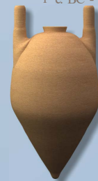
Basket Handle 6 th - 4 th century BC