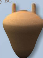
Basket Handle 7 th - 5 th century BC