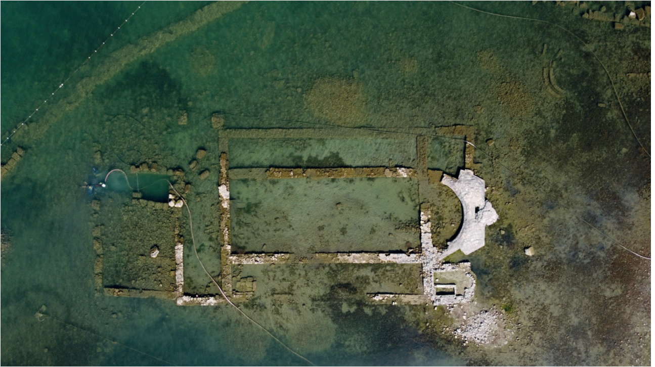
Fig 2: Kalıntıların drone fotoğrafı. Fig 2: A drone photograph of the ruins.