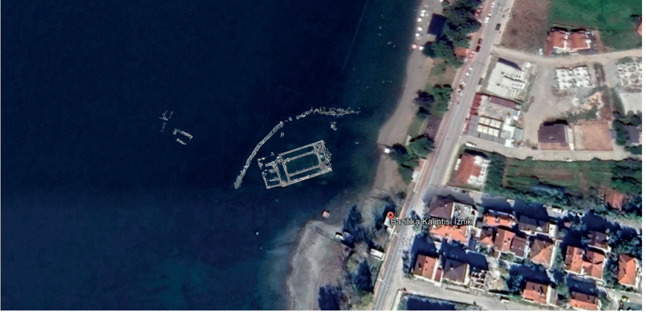
Fig 1: İznik Gölü'nde Batık Halde Bulunan Bazilikal Kilise Kalıntısı. Fig 1: Basilica Church Ruins Revealed Underwater in the Lake İznik.