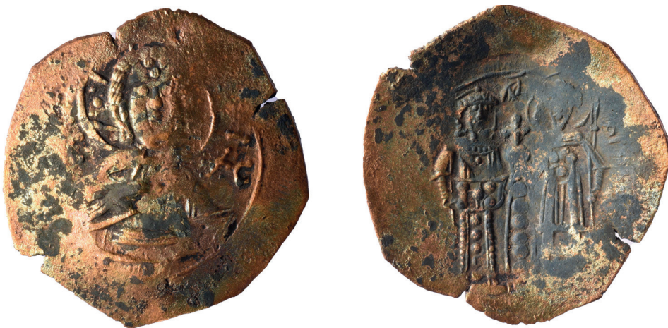
Fig. 7: III. Aleksios Angelos (1185-1203)

Fig. 6: A coin from the period of Alexios III Angelos (1185-1203)