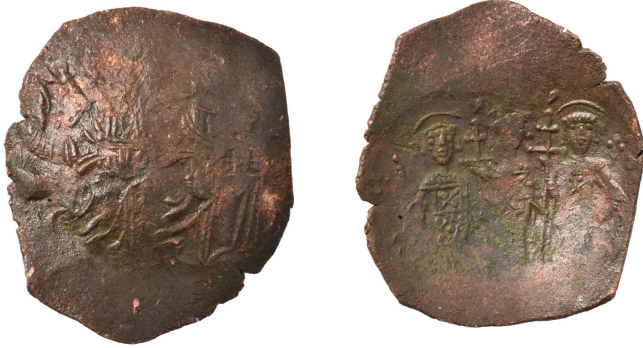
Fig. 9: Latin İmparatorluğu Dönemine (1204-24)

Fig. 8: A coin from the period of Theodore I Komnenos Laskaris (1205/8-1221)