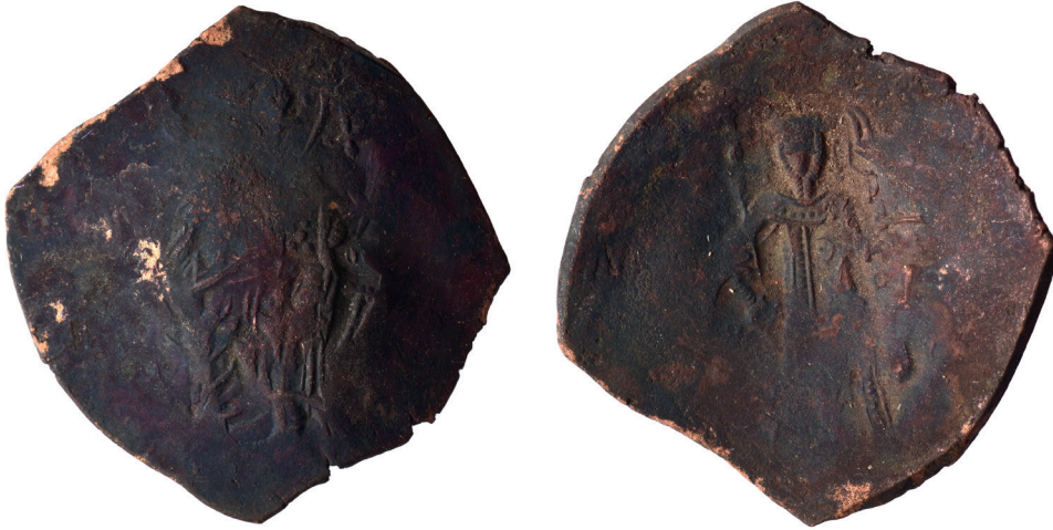
Fig. 11: I. Theodoros Laskaris (1204-1222)