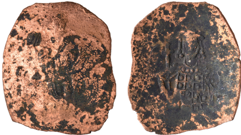
Fig. 4: A coin from the period of John II Komnenos (1118 - 1143)