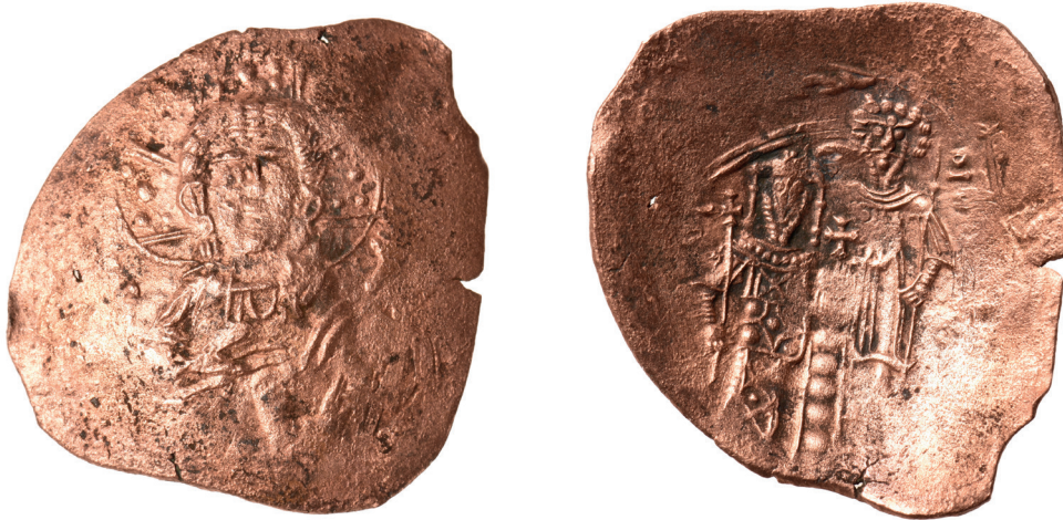
Fig. 6: III. Aleksios Angelos (1185-1203)

Fig. 5: A coin from the period of Isaac II Angelos (1185-1195)