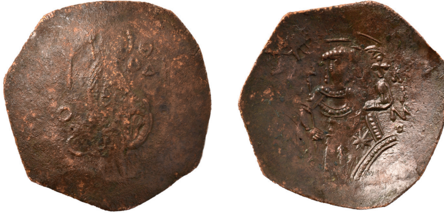
Fig. 12: III. Ioannes Doukas Vatatzes Sikkesi (1221 – 1254) Fig. 12: A coin from the period of John III Doukas Vatatzes (1221 – 1254)

Bazilikal Kilise'nin atrium bölümünde yer alan ve mikveh benzeri baptisterium olduğunu düşündüğümüz U-şeklindeki yapıda 2019-2022 yılları arasında sürdürülen sualtı kazılarında ele geçen sikkelerden 1 adeti II. Ioannes Komnenos, 5 adeti II. Isaakios Angelos, 5 adeti III. Aleksios Angelos, 7 adeti Theodoros Komnenos, 1 adeti Latin İmparatorluğu Dönemi, 71 adeti I. Theodoros Laskaris ve 8 adeti III. Ioannes Doukas Vatatzes dönemlerine aittir (Fig. 13). En erken tarihli olan sikke II. Ioannes Komnenos dönemine (1118 - 1143), en geç tarihli olan örnek ise III. Ioannes Doukas Vatatzes dönemine (1221 – 1254) aittir. III. Ioannes Doukas Vatatzes sikkelerine göre MS. 13. yüzyılın ortalarına doğru alan terk edilmiştir.