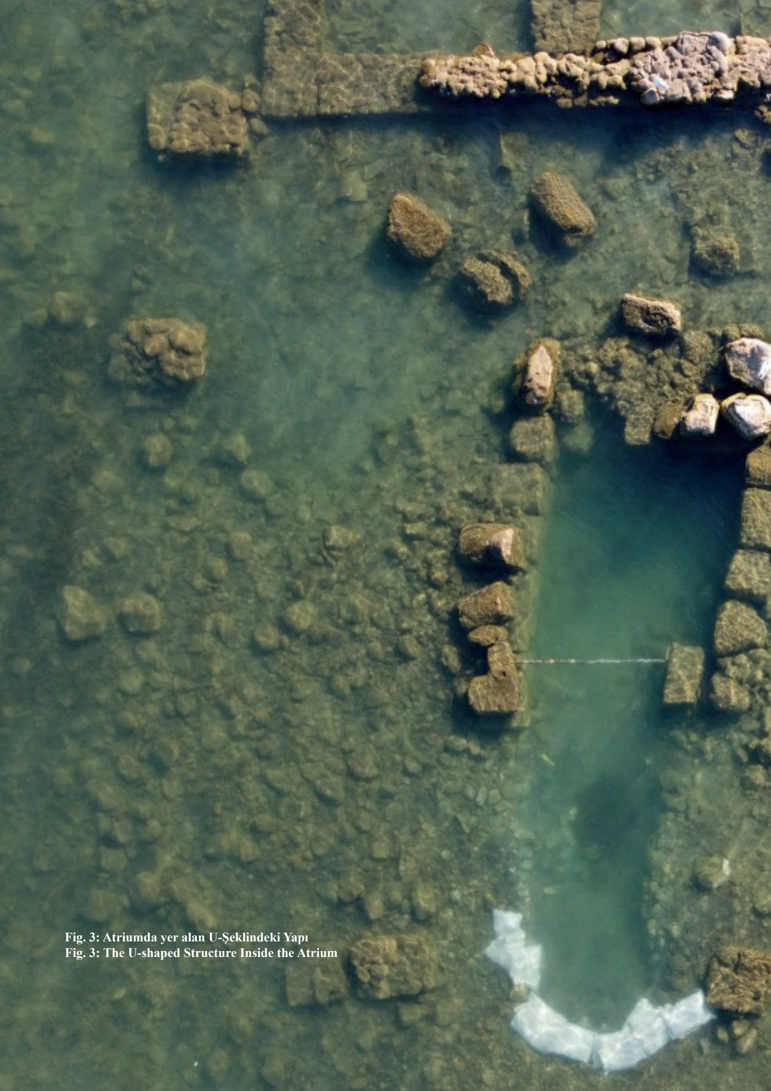
Fig. 3: Atriumda yer alan U-Şeklindeki Yapı Fig. 3: The U-shaped Structure Inside the Atrium