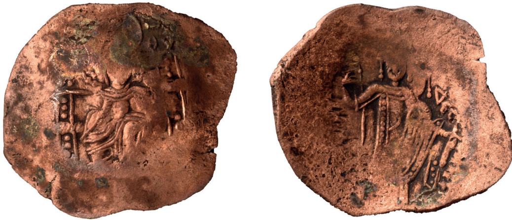
Fig. 5: II. Isaakios Angelos (1185-1195)

Fig. 5: A coin from the period of Isaac II Angelos (1185-1195)