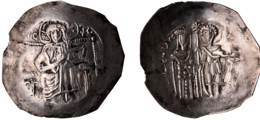
Fig. 10: I. Theodoros Laskaris (1204-1222)