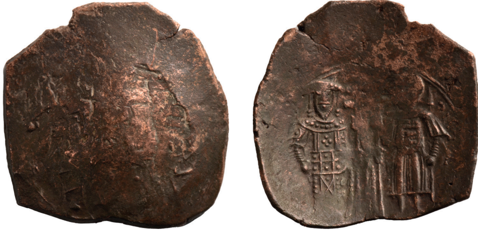
Fig. 8: Theodoros Komnenos Sikkesi (1205/8-1221)

Fig. 8: A coin from the period of Theodore I Komnenos Laskaris (1205/8-1221)