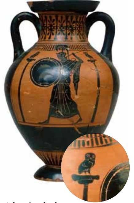
Sağ Elinde Baykuş ile Athena

Athena’nın baykuşu, MÖ 510’dan sonra Atina sikkelerinde ortak ön yüz betimi bile olmuştur. Hatta Philochorus’a göre, Atina tetradrahmi antik dünyada glaukes (γλαυκῆς,, baykuşlar) olarak ünlenmiştir.