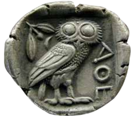
Gümüş Tetradrahmi Üzerinde Athena’nın Baykuşu

Athena’nın baykuşu, MÖ 510’dan sonra Atina sikkelerinde ortak ön yüz betimi bile olmuştur. Hatta Philochorus’a göre, Atina tetradrahmi antik dünyada glaukes (γλαυκῆς,, baykuşlar) olarak ünlenmiştir.