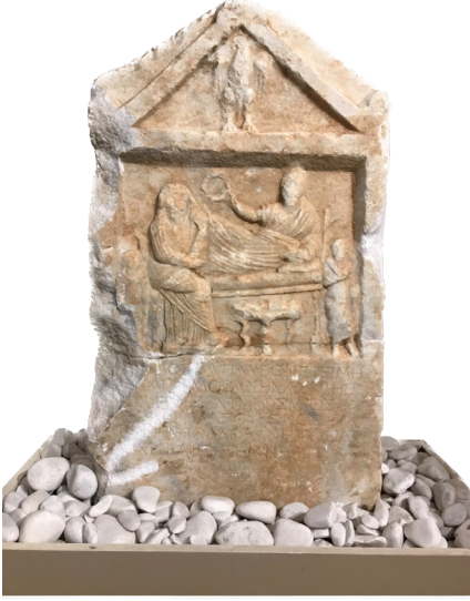
Fig. 6 Apollophanes ve Metrophila'nın Mezar Steli