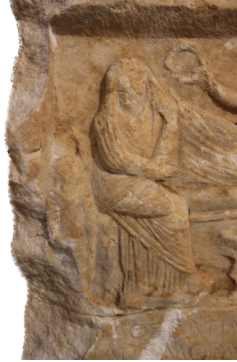
Fig. 9 Metrophila ve Kız Hizmetçiden Detay