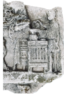
Fig. 3 Mobilyalardan Detay