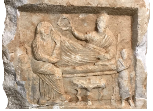
Fig. 8 Ziyafet Sahnesinden Detay