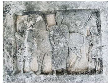
Fig. 5 Alt Resim Alanından Detay