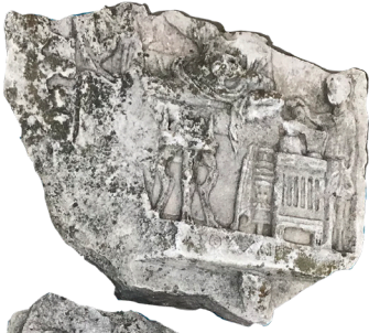
Fig.1 Katlı Mezar Steli