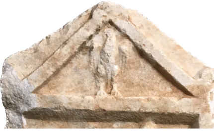
Fig. 7 Alınlıktan Detay