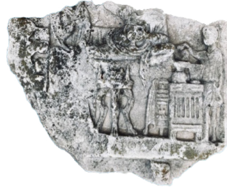
Fig. 2 Ziyafet Sahnesinden Detay