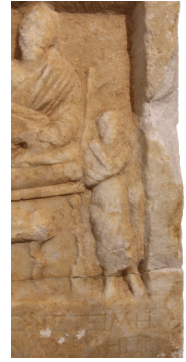
Fig. 10 Erkek Hizmetçiden Detay