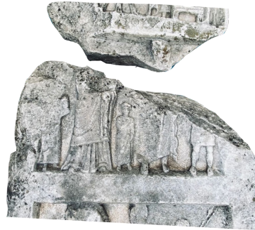
Fig. 4 Ortadaki Resim Alanından Detay