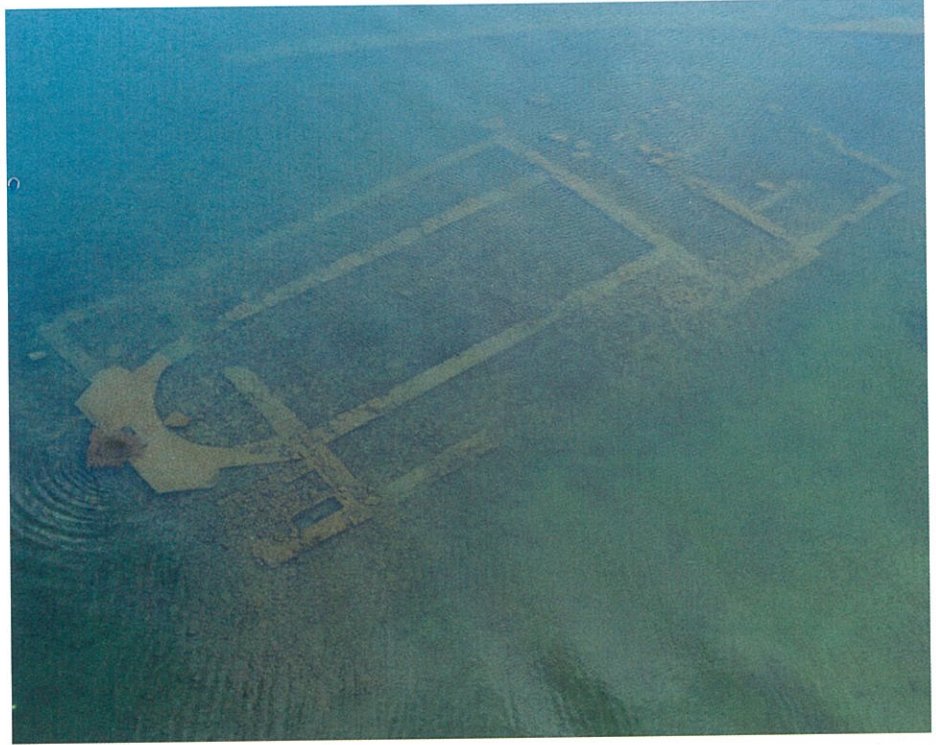
7. Konsilin toplandığı kilise

Hava fotoğrafında bir başka dikkati çeken iz ise, bazilikanın kuzey yönünden kıvrılarak batıya doğru devam eden geniş boyutlu bir duvar kalıntısı. Bu duvar, Nikeia kentini göl tarafından koruyan surun bir parçasından çok, bazilikayı göl sularından korumak üzere inşa edilen bir teras duvarı gibi durmaktadır. Ancak şu var ki, Nikeia, Hristiyanlığın ilk dönemlerinden itibaren Konstantinopolis'e yakın jeopolitik konumu ve 325 yılında toplanan ve imparator büyük Konstantin'in de bizzat katıldığı I. "Ökumenik Konsil"e ev sahipliği yapmış, Aziz Tryphon gibi din şehitleri vermiş, önemli din alimleri yetiştirmiş, pek çok kuşatmaya göğüs germiş bir merkez olarak tarih boyunca hep ön sırada adından söz ettirmiştir. Yazılı kaynaklardan kentte çok sayıda kilise bulunduğu bilinmektedir. Bu anıtsal yapılardan Ayasofya Kilisesi, üzerinde yapılan pek çok değişikliğe rağmen günümüzde hala ayakta. VII. Ökimenik Konsilin toplandığı Hyakinthos Manastırı-Koimesis Kilisesi ise İznik'in Kurtuluş Savaşı'nda Yunanlılar'dan geri alınması esnasında yıkılmıştır. Bazı yüzey araştırmaları ve arkeolojik kazılarda, kime adandığı veya ismi bilinmeyen başka kilise kalıntıları da bilinmektedir. Peki nasıl bir felaket bu anıtsal yapıyı göl sularının altına gömdü? İşte bu aşamada yazılı kaynaklar imdadımıza yetişiyor. 740 yılında yaşanan büyük depremde; Ayasofya ve Koimesis kiliseleri de dahil olmak üzere kentteki neredeyse bütün yapıların harabe