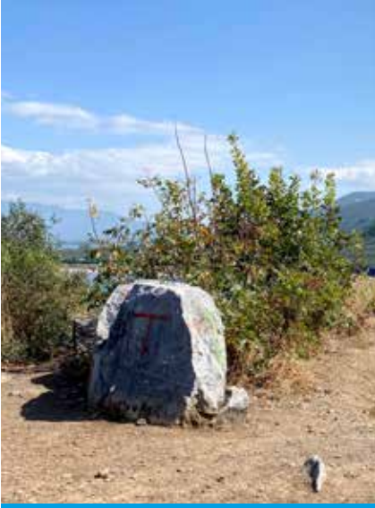
Ana kaya kesilerek oluşturulan köşeli bloklar