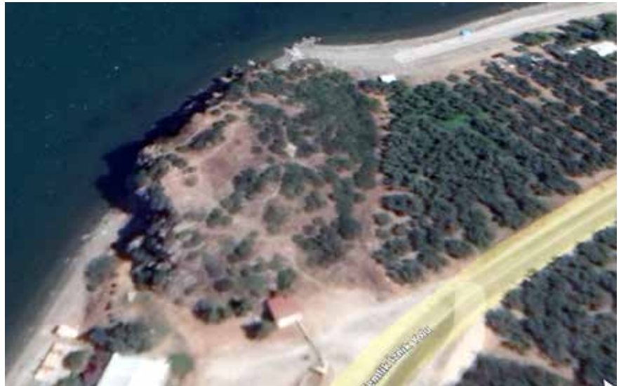
Karacakaya'ya ancak güneyden tırmanılabilmektedir