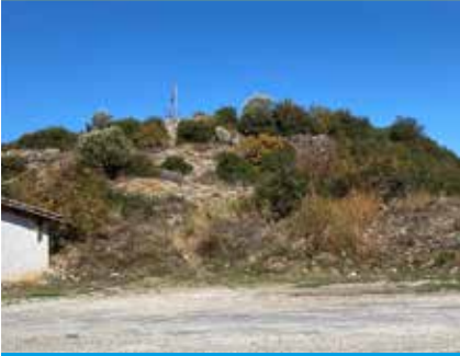
Yol kenarından Karacakaya'nın zirvesine çıkan patika yol