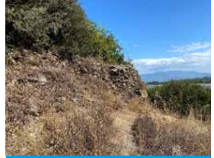
Doğu-batı istikametinde uzanan moloz taş duvar