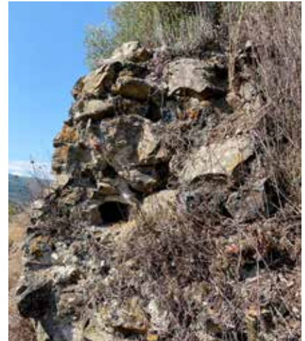
Moloz taş duvardan detay, ahşap hatılların delikleri varlığını devam ettirmekte