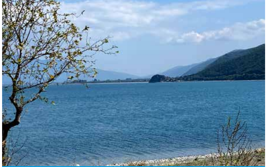
Göllice kıyılarında Karacakaya'ya bakış