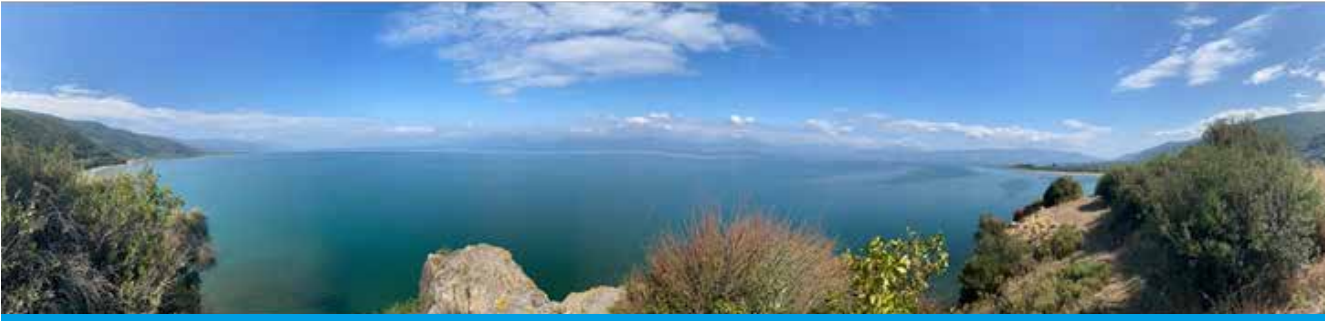
Karacakaya doğuda İznik'e, batıda Orhangazi'ye kadar geniş bir alana hakimdir