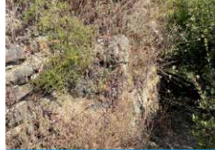
Doğu-batı istikametinde uzanan moloz taş duvar