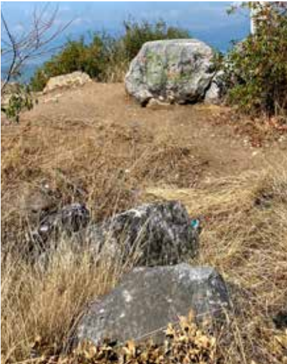
Bayrak direğinin dibinde blok taşlar