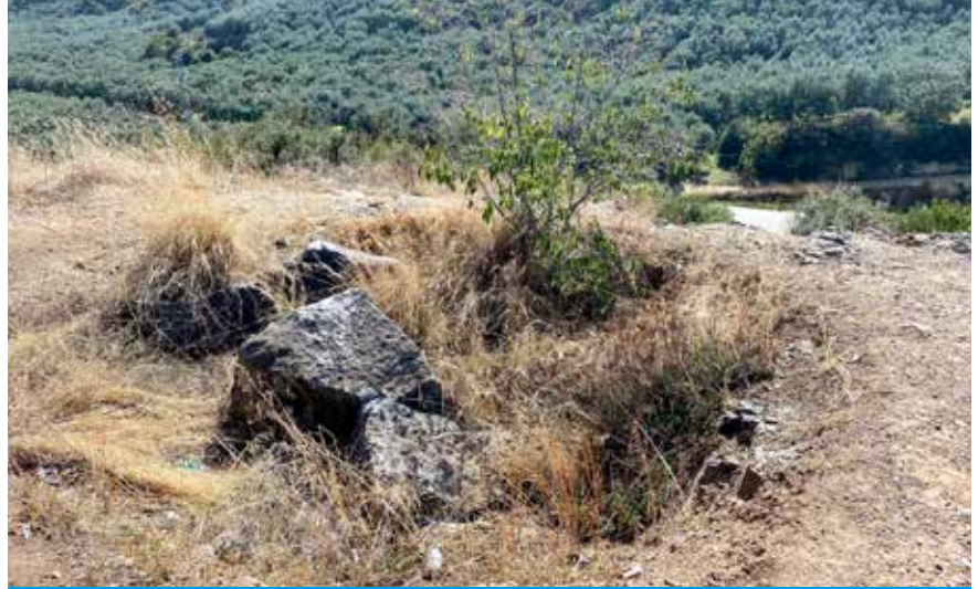
Defineciler tarafından oluşturulan çukur ve blok taşlar