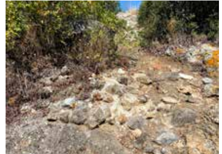
Kireç harçlı moloz taş duvar