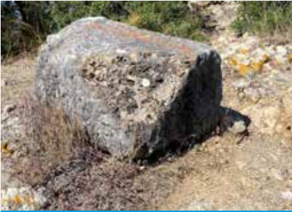
Tırmanış yoluna dağılan blok taşlar