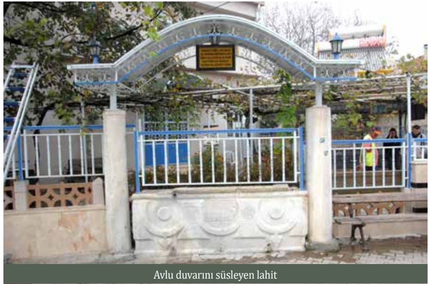
Avlu duvarını süsleyen lahit