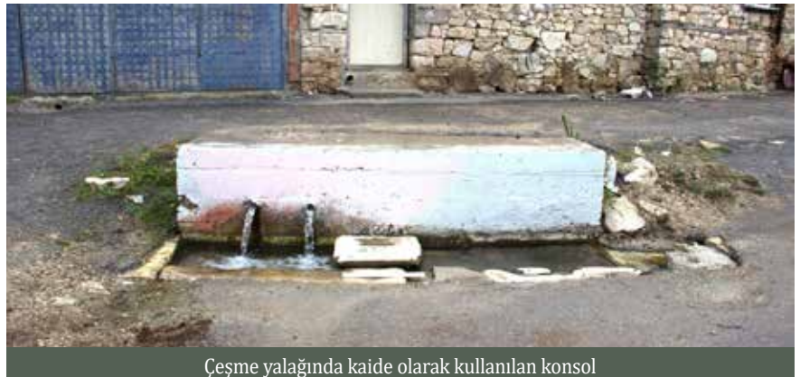
Çeşme yalağında kaide olarak kullanılan konsol