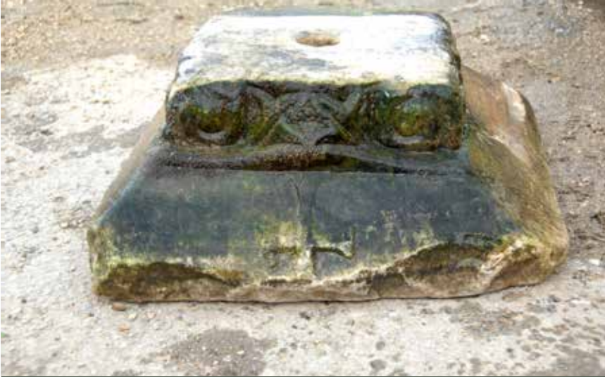
Üzerinde Latin haçı bulunan mermer konsol

muza oluşturan Balıklıpınar Ayazması'nın hangi dertlere iyi geldiğini bilemiyoruz. Bununla birlikte İstanbul'daki Balıklı Ayazması veya genel olarak ayazmalar göz önünde bulundurulursa, bunların daha ziyade bir kilisenin parçası olduğu ve pek çok ayazmanın kilise bahçesinde yer aldığı anlaşılmaktadır. Kompleksin hemen yanı başında ise çoğunlukla mezar alanı bulunmaktadır.