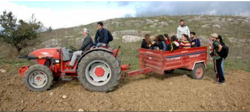
Bir traktörün kasasında araştırma ekibimiz

Kültür ve Turizm Bakanlığının izni ve Nilüfer Belediyesinin desteği ile 2014 yılında Büyükbalıklı'ya yaptığımız ziyarette (Resim 12), mahalle sakinleri balıkların yaşadığı alanın aslında şadırvan havuzu ile sınırlı kalmadığını, toprak altında havuzu besleyen kanalların bulunduğunu ve bu kanalların mahalle meydanının altında da devam ettiğini söylediler. 1966 yılında yapılan caminin temellerinin altında ne tür bir bina vardı, bilemiyoruz. Ancak, alanda meydan düzenlemesi ile olası kanalları açmak mümkündür. Böylece mahalle inanç turizmi konusunda Bursa'nın önemli ziyaret noktalarından birisi olabilir. Günümüzde ayazmaların birçoğu kaybolmuş veya sadece isim olarak varlıklarını devam ettirmektedirler. Ayazmaların büyük bölümü bu süreçte kentleşmeden etkilenmiş, varlığını sürdüren ayazmaların çoğunun suyu ya kurumuş ya da kirlenmiştir. Bütün bu gelişmelere rağmen ayazmaların