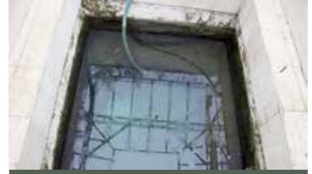
Şadırvanın ortasında yer alan su kaynağı

lar birtakım hastalıklar için sürekli gi-dilen adreslerdendir. Eğer hasta ayaz-maya gidemeyecek kadar düşkünse, kaynaktan alınan su şişelenerek hastaya götürülür. Bunun neticesin-de de “ayazma kültü” adı verilen bir inanç sistemi ortaya çıkar. Ülkemizin değişik yerlerinde bir kısmı hâlihazır-da ziyaret edilen, bir kısmı ise zaman içinde unutulmuş pek çok ayazma bulunmaktadır. Ayazmada şifa bulan kişi bir sonraki gelişinde beraberinde kandiller için yağ, süpürge ya da faras getirir. Küçük bir bebek, anahtarlık tarzı şeylerin getirildiği de olur. Bazı ayazmalarda muradın olması için duvarlara yazı yazıldığı da görülür. Bazen de hasta olan kişinin atleti ya da giysisi getirilerek ayazma suyu ile yıkanır ve giysi tekrar hastaya giydirilerek hastanın şifâ bulması beklenir.