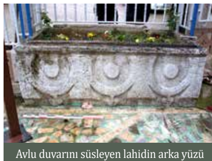
Avlu duvarını süsleyen lahitin arka yüzü