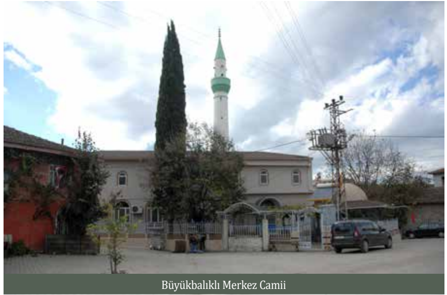
Büyükbalklı Merkez Camii

Bilindiği gibi, su hayat ve şifâ kaynağı olarak kabul edilmekte, suyun saflığı ve sürekliliği ölümsüzlüğü çağırıştır. Bu nedenle Pagan dönemlerinden başlayarak su kaynakları kutsal kabul edilmiş ve özel korumaya alınmışlardır. Hititler su kaynaklarını anıtlar ile koruma altına almaya