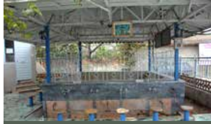
Camii avlusunda yer alan şadırvan