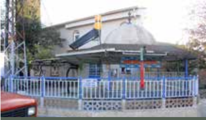
Camii avlusunda yer alan şadırvan