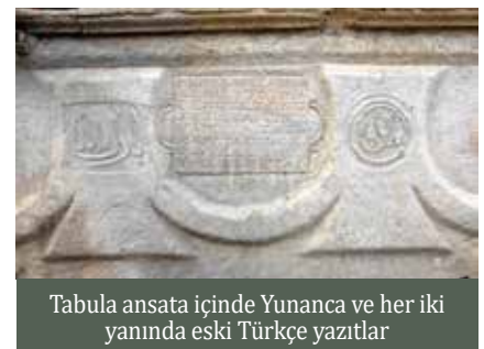
Tabula ansata içinde Yunanca ve her iki yanında eski Türkçe yazıtlar

çalışırken, daha sonra bu görev su tanrılarına veya perilerine (nympheler) havale edilmiştir. Hatta her suyun, özellikle deniz ve ırmakların, canlı varlık olduğuna inanılmış, deniz ve akarsuları koruyan kendi tanrıları olduğuna inanılmıştır.