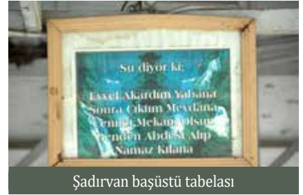
Şadırvan başüstü tabelası

avlusunda yer almaktadır. Zeytinbur-nu’ndaki Balıklı Ayazma’nın geçmişi-nin Bizans devrine kadar dayandığı söylenmektedir. Ayazmada şapel ile ayazma iç içe geçmiştir. Ayazmanın takip edilebilen tarihi MS 5. yüzyıla kadar geri gitmekte, inşâ eden kişinin Doğu Roma İmparatoru 5. Leon (MS 813-820) olduğu söylenmektedir. Daha sonra İmparator Justinianus (MS 527-565) çiçekli çayırıları ve meyve ağaçları ile insana huzur ve-ren bir mevkide bulunan ayazmayı esaslı biçimde elden geçirtmiştir. Bu onarım esnasında küçük bir şapel eklendiği de söylenmektedir. 1863-64 yılları arasında İstanbul’da Osmanlı Bankası’nda çalışan Fransız Rene du Parquet buradan bahsederken pek çok hastanın battaniyeye sarılmış bir vaziyette yerde yattığını ve başların-da onları buraya getiren yakınlarının bulunduğunu anlatmaktadır. Kalp ve bacak ağrılarına iyi geldiğine inanılan ayazmaya 19 basamaklı merdiven ile inilmektedir. Toplam dört musluğun olduğu ayazmada dileyen bardakla su içebilmekte, dileyen ise plastik şişelere konmuş suları beraberinde götürebilmektedir. Musluğun tam karşısında ise küçük bir şapel bulun-maktadır. Ayrıca mum yakmak için iki mumluk da bulunmaktadır. Kaynağın içinde ise Büyükbalıklı’da olduğu gibi ayazmaya adını veren ve çeşitli efsa-nelere konu olan balıklar bulunmak-