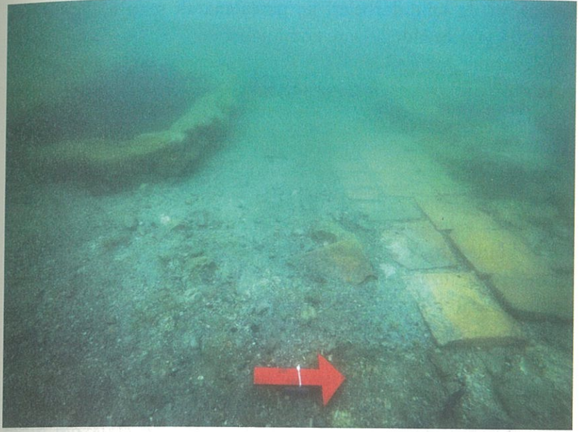
Resim 2: Diakonikon mezarları

rak Bithynia Olymposu'nda dünyaya gelmiştir. Neophytos, daha çocukluk çağlarından itibaren gösterdiği çeşitli mucizeler ile kutsal bir kimlik taşıdığını belli etmiştir. Henüz dokuz yaşında iken, kendisine görünen güvercini dağdaki mağaraya kadar takip etmesi ve mağarada yaşayan vahşi hayvanı kovarak on altı yaşına kadar burada kalması en büyük mucizelerinden biridir. Daha sonra rüyasında kendisine gözüken Tanrı'nın buyruğu ile, Hıristiyanlara karşı büyük zulüm zamanı olmasına rağmen, Nikaia'ya gelmiş ve açıkça kimliğini ifşa etmiştir. Bu yüzden yakalanıp inancından vazgeçmesi istenmiş, kabul etmediği için işkencelere maruz kalmıştır. Bir ağaca asılıp kırbaçlandığı, demir çengeller ile derisinin yırtıldığı, aç bırakılmış vahşi hayvanların önüne atıldığı ancak hayvanların ona zarar vermediği, son olarak da günlerce kızgın fırında bekletildiği söylenmektedir. Fakat güçlü bir inanca sahip olan bu genç Hıristiyan, her defasında hiçbir zarar görmeden sağ kalmayı başarmıştır. En nihayetinde, kentin göl tarafındaki surlarının dışında, sahil ile surlar arasındaki bir noktada imparatorluk askerleri tarafından