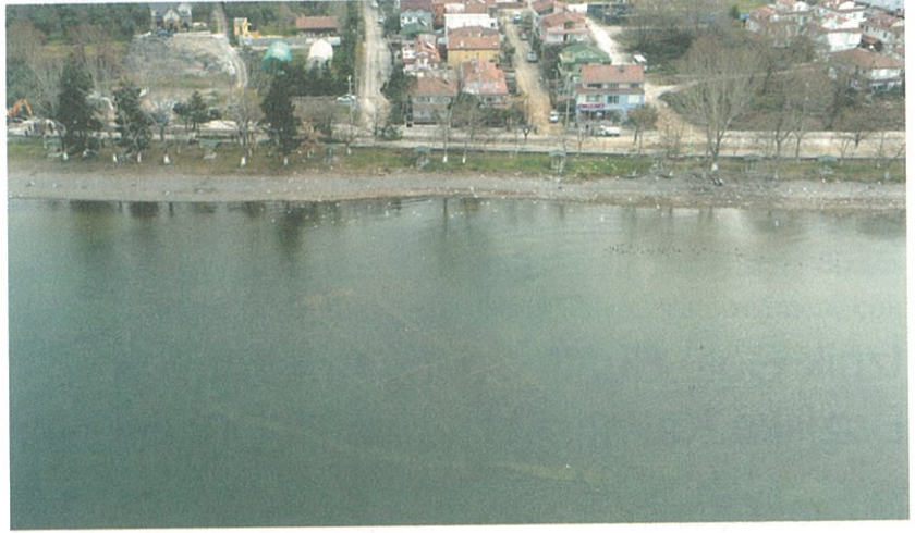
Resim 1: Kalıntıların havadan görünüşü.

izni ile başlamıştır. 3 Bunu Kültür Varlıkları Genel Müdürlüğü'nün 19.10.2015 tarih ve 196372 sayılı izni ile İznik Müzesi Müdürlüğü başkanlığında başlatılan sualtı kazıları takip etmiştir. Sualtı araştırma ve kazıları, ilk günden beri Bursa Büyükşehir Belediyesi tarafından desteklenmektedir. 4