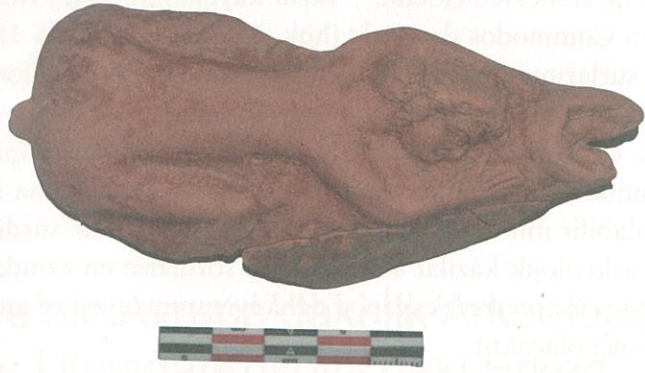
Resim 3: Bazilika kazılarında bulunan erotik figürin (Fotoğraf: Kazı Arşivi).

na ait bir manzara görüntüsüne yer verilmesi, freski konumuz açısından ilginç hale getirmektedir. Kazılar ilerledikçe bazilika zemininin mozaikle mi, yoksa opus sectile ile mi kapatıldığı daha iyi anlaşılacaktır. Pencereden gösterilen manzarada ise toplantının yapıldığı yapının sur duvarlarının dışında ve İznik Gölü'ne yakın bir yerde olduğu anlaşılmaktadır. Sur duvarı üzerinde görülen kule her ne kadar Vatikan'daki Hadrianus Mezarı'na benzese de yapının göl kıyısında gösterilmesi ilginçtir ve İznik Gölü'nde keşfettiğimiz bazilikayı akla getirmektedir. Acaba Birinci Konsil Toplantısı'nın yapıldığı Senato Sarayı burası mıydı?