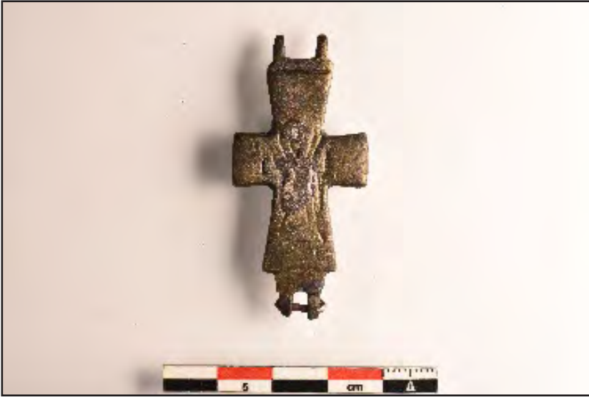
Resim 12: Röliker haç, 10-12. yüzyıl.