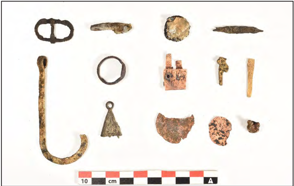
Resim 10: Açmadan ele geçirilen metal buluntuları.