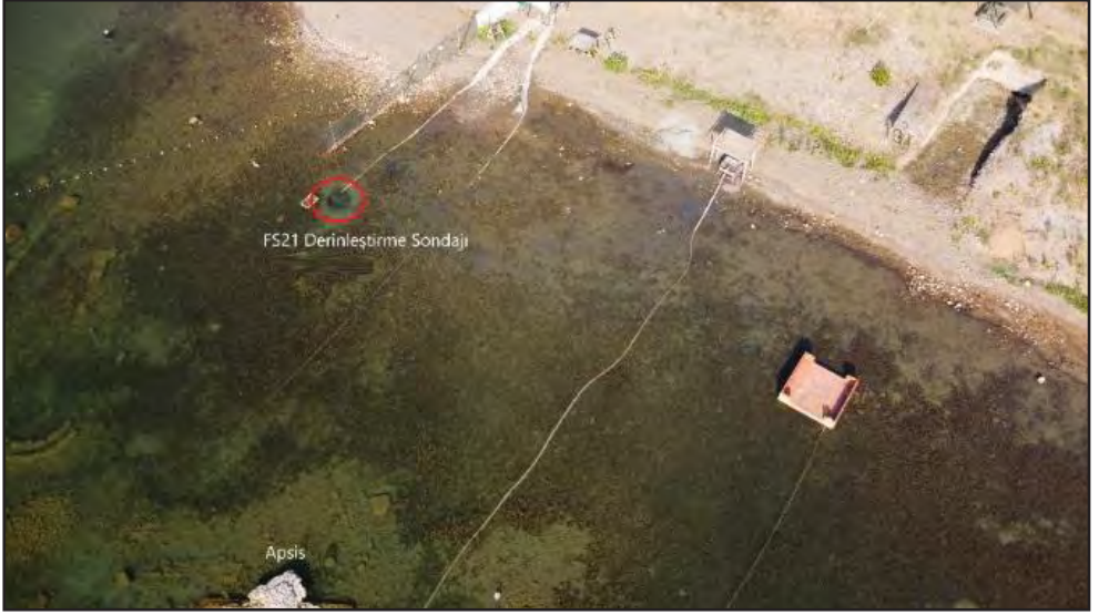
Resim 13: Filtre derinleştirme sondajı.