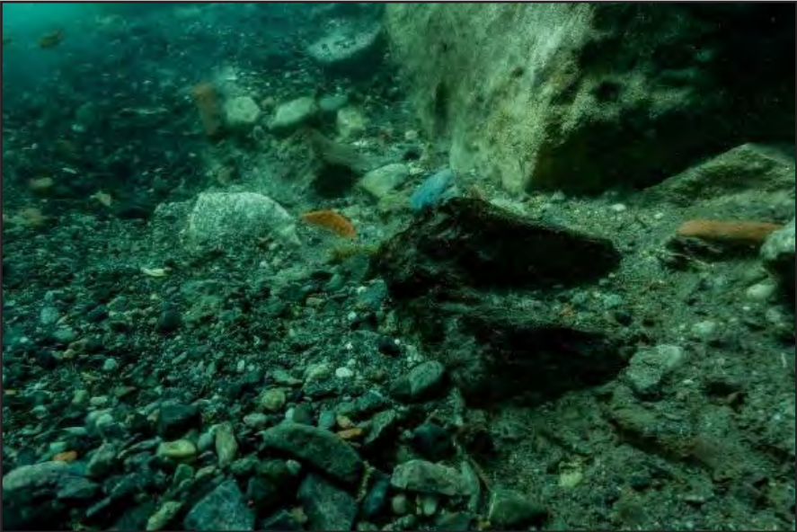
Resim 2: Kuzeybatı köşede yer alan ahşap hatıl.