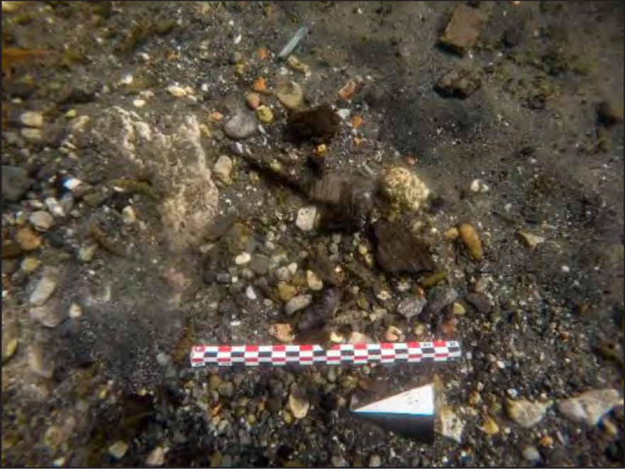
Resim 1: Açma yüzeyinde bulunan ahşap parçaları.