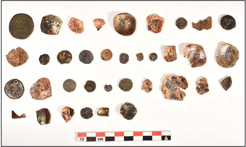
Resim 9: Açmadan ele geçirilen sikke buluntuları.