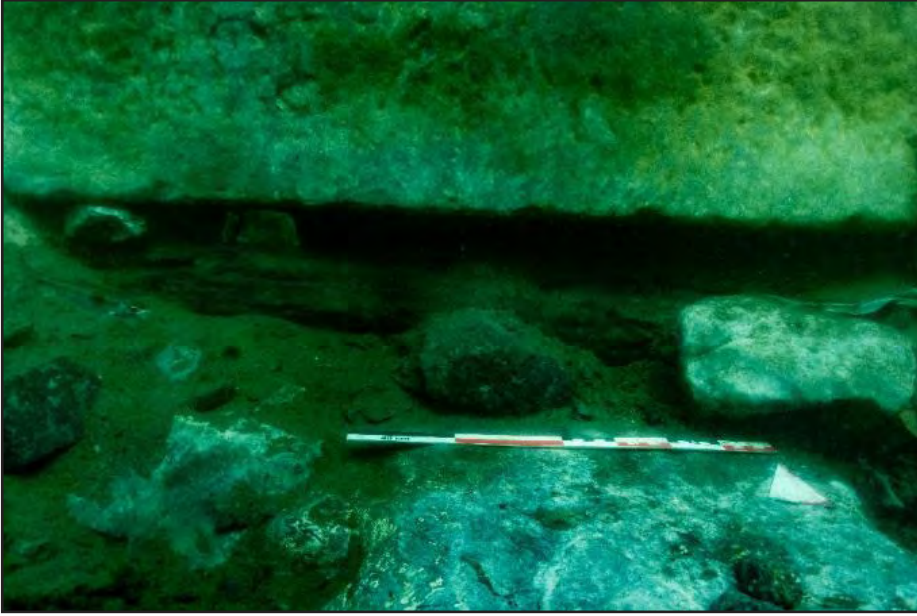
Resim 3: Kuzey duvarının dibinde yer alan hatıl.