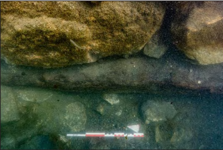
Resim 4: Doğu duvarında yer alan ahşap hatıl.