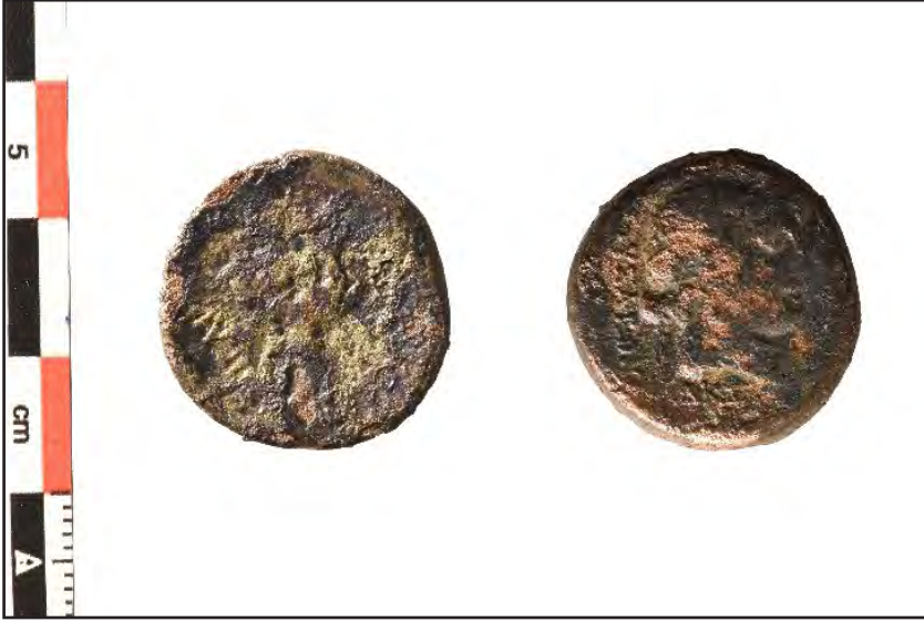
Resim 11: C. Papirius Carbo (Bithynia-Pontus Prokonsülü), M.Ö. 62-59 Dönemi sikkesi.