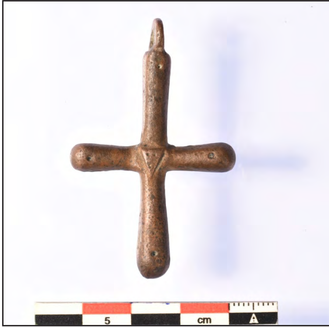
Resim 14: Tarihlendirilmesi yapılmış bronz haç.