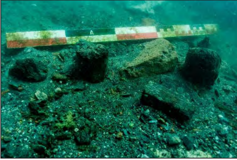
Resim 5: Yüzejde tespit edilen ahşap dikmeler.