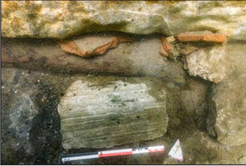
Resim 7: Kuzeydoğu duvarındaki devşirme mimari parça.