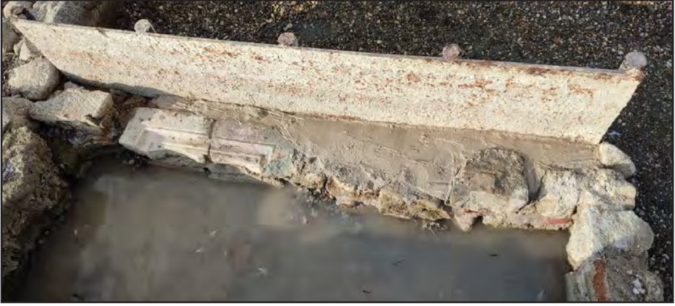
Resim 15: Martyrium lahdinin uzun yüzü, onarım sonrası.