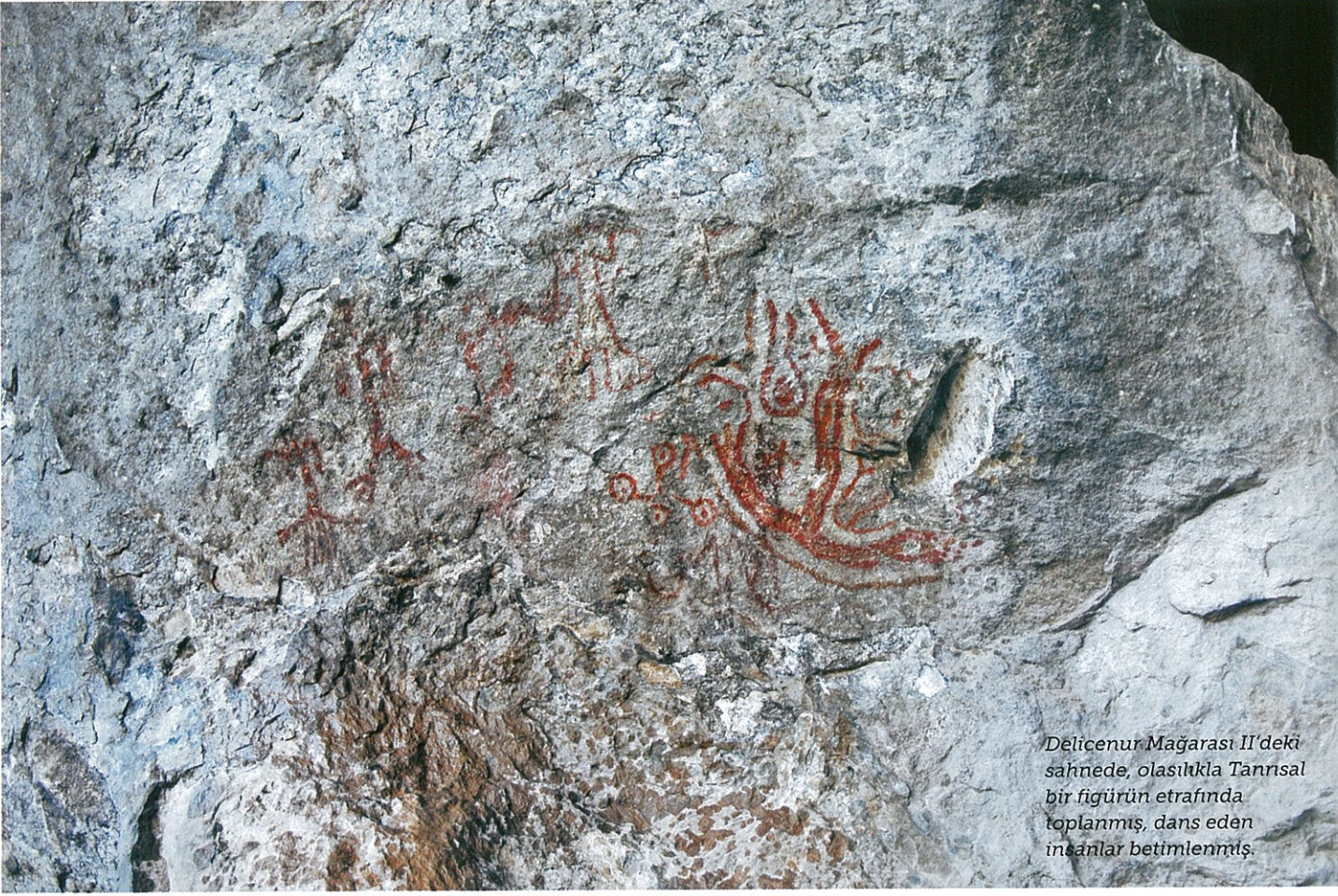
Delicenuur Mağarası II'deki sahnede, olasılıkla Tanrısal bir figürün etrafında toplanmış, dans eden insanlar betimlenmiş.