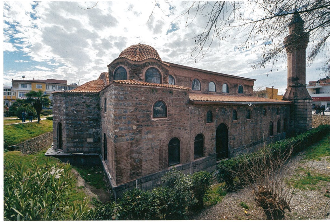
Camiye çevrilen İznik Ayasofya Kilisesi'nin planı, göl içinde kalıntıları bulunan bazilikaya çok benziyor. Ayasofya'nın orta nef kubbesinde freskolar bulunuyor (karşı sayfada). Ayasofya, İznik'te günümüze kadar ulaşabilmiş en eski tarihi yapılardan. Kilise 14. yüzyılda camiye dönüştürüldü; bir dönem müze olarak kullanıldıktan sonra 2011'de yeniden ibadete açıldı (solda). Ayasofya'da azizlerin defnedildiği lahitler bulunuyor (altta).

İS 4. yüzyıl sonu- 5. yüzyıl başına tarihlenen bu bazilika da üç neflidir, doğusunda kısmen içe çekilmiş apsisi, pastophoralar, batısındaki nartheksi ve atriumu (iç avlu) ile aynı tasarımın ilk temsilcilerindendir. Ürdün Gerasa'da Aziz Theodor Kilise Kompleksi'ndeki, İS 496'da yapılan üç nefli bazilika ile İS 529-533 yıllarına tarihlenen Vaftizci Yahya Kilise Kompleksi'ndeki bazilikaların apsis planlamaları da kısmi farklılıklarla ortak özellikler taşır.