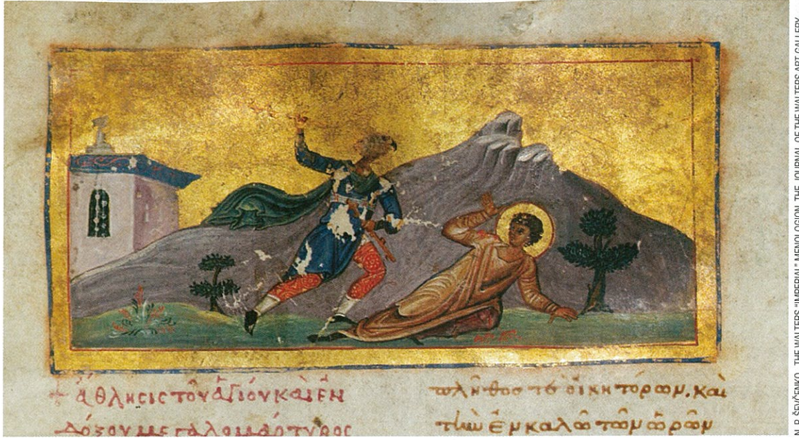
Aziz Neophytos'a yapılan işkenceyi gösteren minyatürlü elyazması, 11. yüzyılın ikinci çeyreğinden kalma.

N. P. SEVÇENKO, THE WALTERS "IMPERIAL" MENOLOGION, THE JOURNAL OF THE WALTERS ART GALLERY