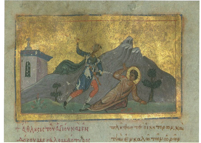
Aziz Neophytos'un işkence ve şehit edilmesini gösteren minyatür (St. Neophytos, Baltimore, Walters Art Gallery Ms. W. 521, fol. 200r)

varından daha içerde tutulmuş, üç birimli bir mekân yer almaktadır. Hava fotoğrafları, bazilikanın bütün birimlerinin, çökme sonucu oluşan üst yapıya ait moloz ile kaplı olduğunu net biçimde göstermektedir.