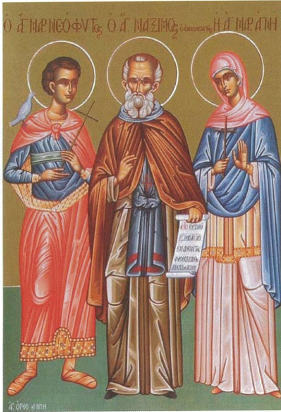
Solda Neophytos, ortada Günah Çıkaran Papaz Aziz Maximus, sağda Agnes

hayvanı kovarak 16 yaşına kadar burada kalmıştır. Daha sonra rüyasında kendisine gözükten tanrının buyruğu ile büyük zulüm sırasında Nikaia'ya gelmiş ve açıkça kimliğini ifşa etmiştir. Bu yüzden yakalanıp inancından vazgeçmesi istenmiş; kabul etmediği için işkencelere maruz kalmıştır. İşkenceler arasında bir ağaca asılıp kırbaçlandığı, demir çengeller ile vücudunun kazındığı, vahşi hayvanlar arasına bırakıldığı, ancak hayvanların ona zarar vermediği görülünce, kızgın fırına atıldığı söylenmektedir. Fakat her defasında kuvvetli bir imana sahip bu genç Hıristiyan, hiçbir zarar görmeden sağ kalmıştır. En nihayetinde, kentin göl tarafındaki surlarının dışında, gölün sahili ile surlar arasındaki bir noktada imparatorluk askerleri tarafından mızrak ya da kılıç darbeleri ile parçalanarak şehit edilmiş ve öldüğü yerde (304 ya da 305 yılı) gömülmüştür.