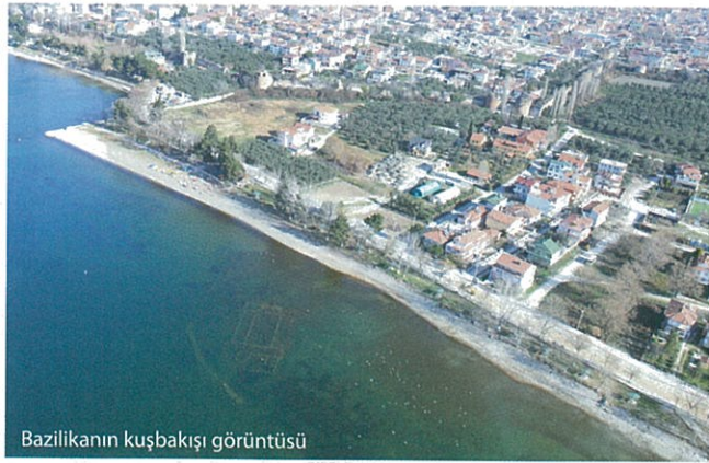
Bazilikanın kuşbakışı görüntüsü

Nikaia/İznik, Hıristiyanlığın ilk dönemlerinden itibaren en önemli dinsel merkezlerden biri olarak yazılı kaynaklarda adından sıkça söz edilen kentler arasındadır. Kent, Konstantinopolis'e (İstanbul) yakın jeopolitik konumu, yumuşak iklimi ve çok sayıda din adamını barındıracak alt yapısı nedeni ile 325 yılında toplanan I. "Ökümenik Konsile" ev sahipliği yapmış;