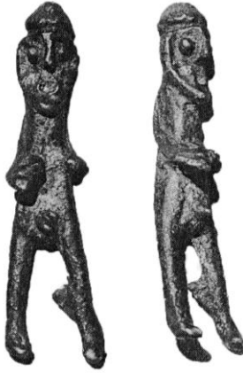
Figür 25: Bronz Figürin. Erzurum (Şahin 1997, 177 Resim 1)