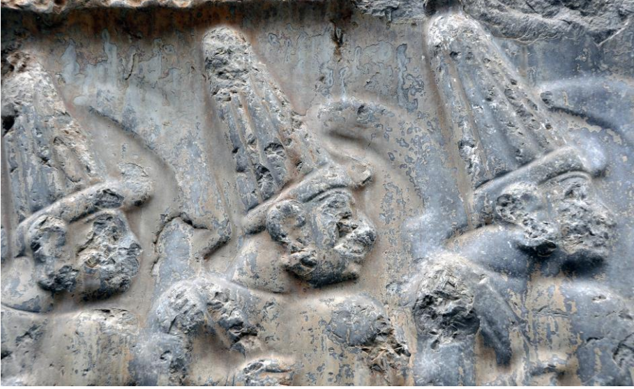
Figür 22: Toplantıya Giden Tanrılar, Yazılıkaya ( https://www.hittitemonuments.com/yazilikaya/yazilikaya40.jpg )