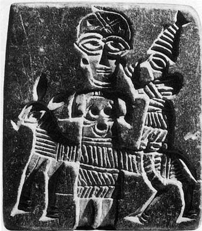
Figür 23: Eşek Üzerinde Tanrı, Kültepe-Kaniş (Haas 1994, 1027 vd. Resim 72a).