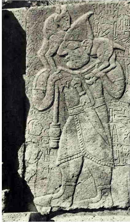
Figür 27: Kurban Taşyan, Karatepe (Akurgal 1966, 141 Levha 34)