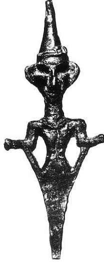
Figür 24: Konik Şapkalı Tanrı, Arapkir (Haas 1994, 1028 Resim 88).