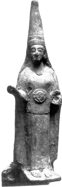
Figür 21: Assos'tan Athena (Villing 1998, 331 Resim 4)