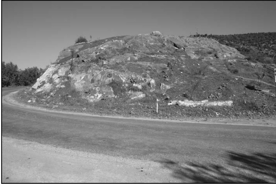
Resim 2: Merdivenli Kaya, merdivenlere doğru bakış