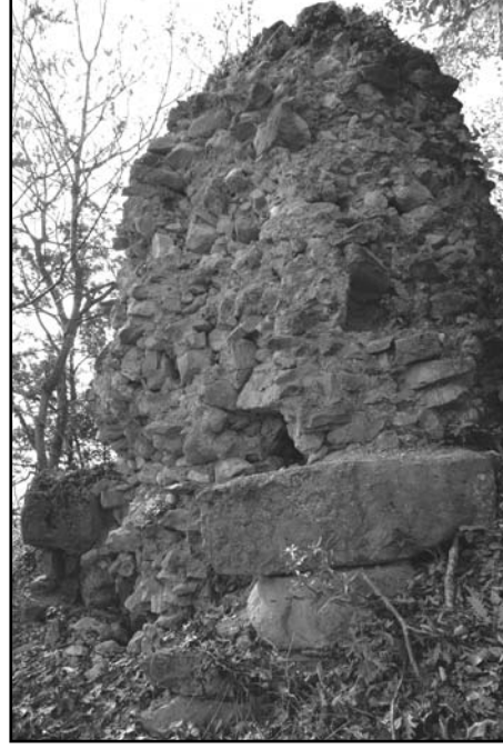
Resim 14: Hisarkale, burç