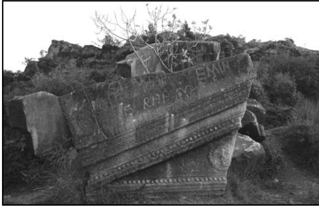
Resim 7: Lahit anıt, Berber Kayası