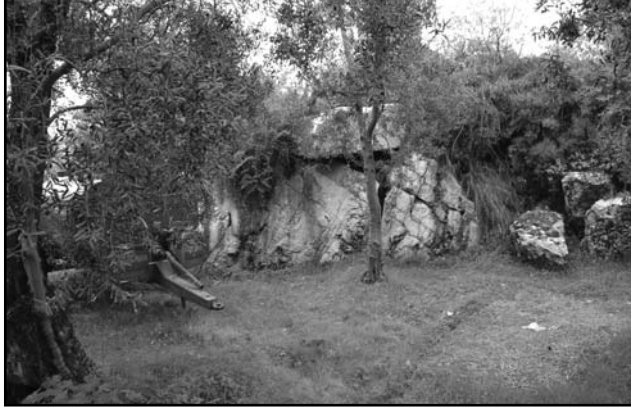
Resim 5: Müşküle, anıt mezar, genel görünüm