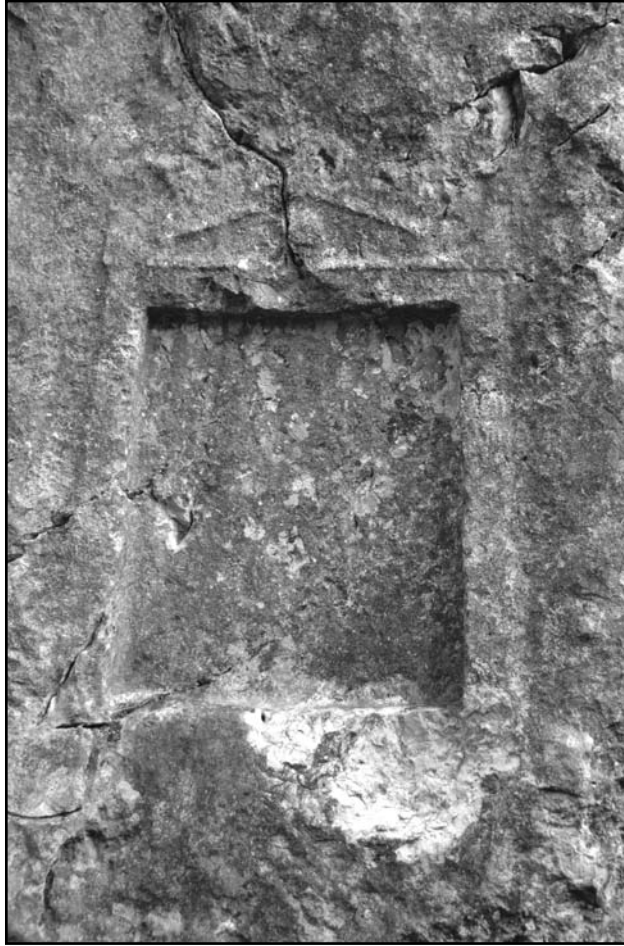
Resim 10: Nili kaya, Detay