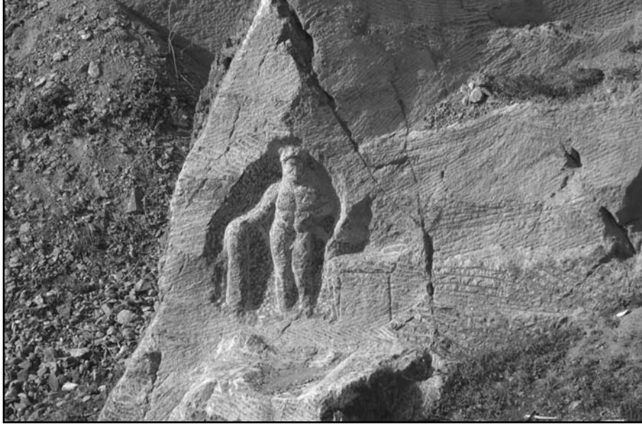
Resim 11: Herakles kabartması, genel görünüm