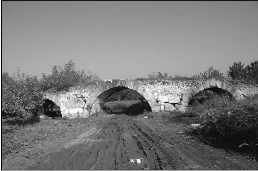
Resim 12: Kuru köprü