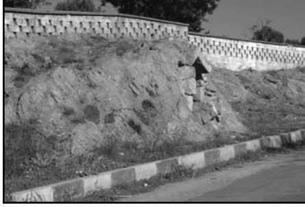
Resim 8: Elbeyli Tmls, genel grnm