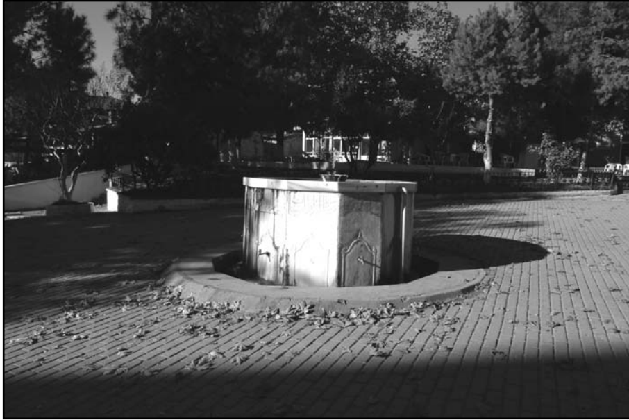
Resim 15: Osmanlı çeşmesi