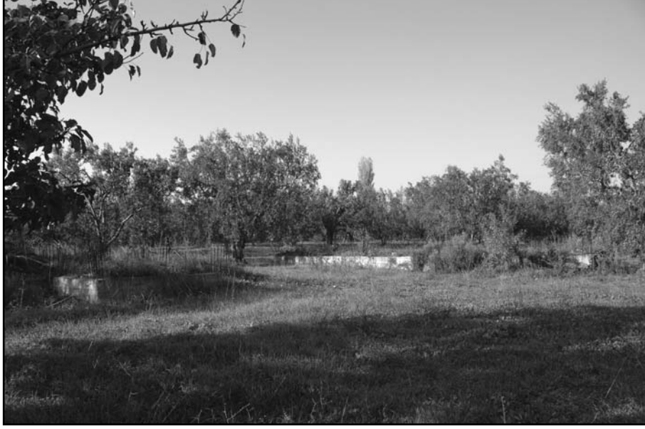
Resim 1: Üyücek Höyük, inşaat temelleri