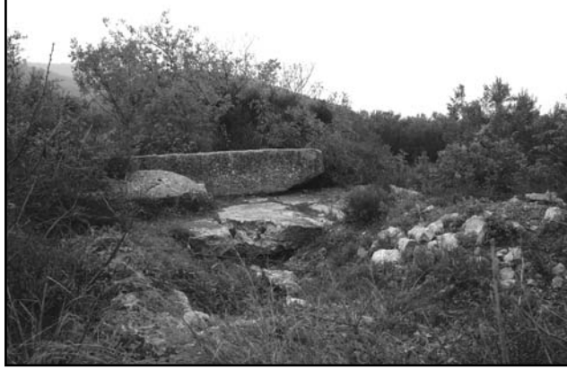
Resim 6: Anıt mezar, üst kısım