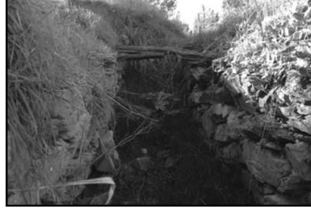
Resim 9: Drttepeler Tmls, dromosun zerini rten kalas